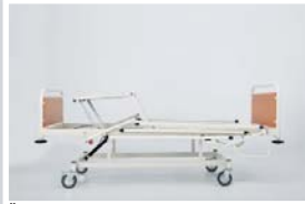
Üst bacak hareketi : 0 - 40°