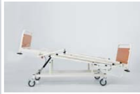
Trendelenburg pozisyonu : 0 - 12°