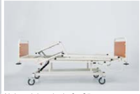
Alt bacak hareketi : 0 - 25°