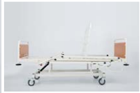
Sırt hareketi : 0 - 70°