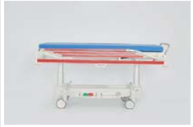
Yatak platformu maksimum yüksekliği : 98 cm