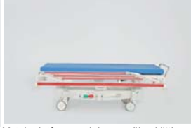
Yatak platformu minimum yüksekliği : 68 cm