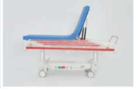
Sırt hareketi : 0 - 70°