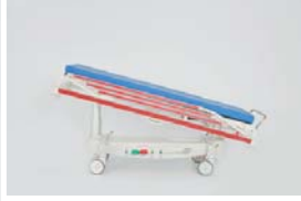
Trendelenburg pozisyonu : 0 - 12°