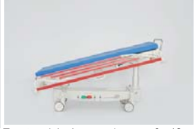
Ters trendelenburg pozisyonu : 0 - 12°