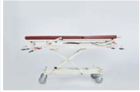
Yatak platformu maksimum yüksekliği : 105 cm