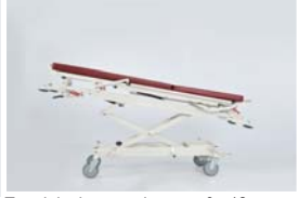
Trendelenburg pozisyonu : 0 - 12°