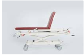
Sırt hareketi : 0 - 65°