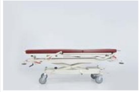
Yatak platformu minimum yüksekliği : 74 cm