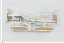
Üst bacak hareketi : 0 - 40°