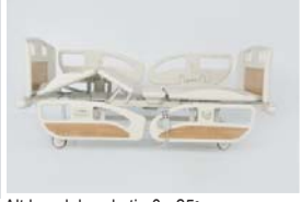
Alt bacak hareketi : 0 - 25°