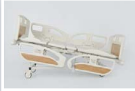
Trendelenburg pozisyonu : 0 - 12°