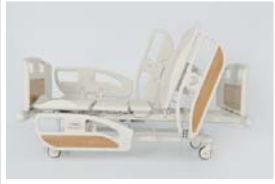
Sırt hareketi : 0 - 70°