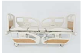
Yatak platform yüksekliği : 49 cm